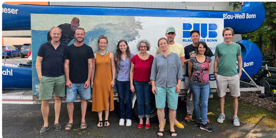
Teilnehmer BWB-EPP 1+2

Theorie an 10 Abenden auf dem Rhein und angrenzenden Gewässern statt. Wir freuen uns, dass alle 9 Teilnehmer den Lehrgang erfolgreich abgeschlossen haben, und zusätzlich Vereinsmitglieder wurden. Es hat allen sehr viel Spaß gemacht.