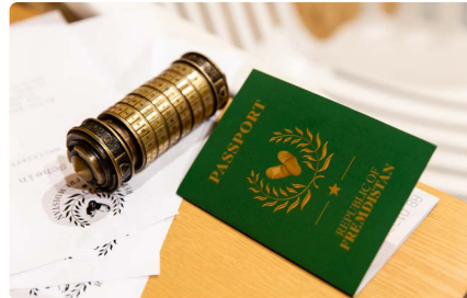
Requisiten des Escape-Rooms

Er wird während der Sommerferien in der Hedwigschule aufgebaut und in Gruppen von 2 bis 6 Personen beispielbar sein. Die Teilnahme ist kostenlos, und eine Runde dauert ca. 1,5 Stunden. Erstmals wird die Spielerfahrung auch mobilitätseingeschränkten Personen zugänglich gemacht, da der komplette Escape-Room barrierefrei umgebaut wird.