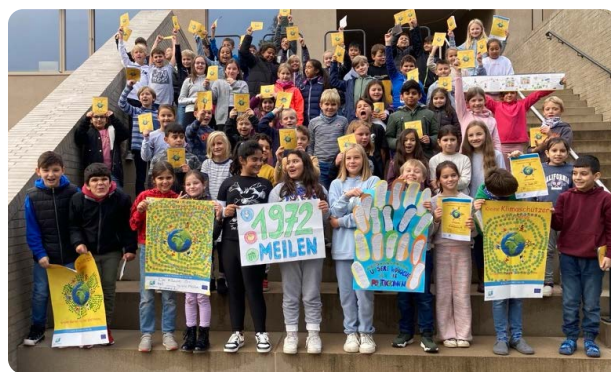
Klimaschutzaktion Klasse 3 der Bernhardschule

Mit dem Wachsen der Schülerzahl musste auch mehr Raum geschaffen werden. Das Schulgebäude wurde immer wieder zunächst provisorisch z.B. mit Containern und zuletzt (2023) mit einem großen Anbau erweitert. Leider