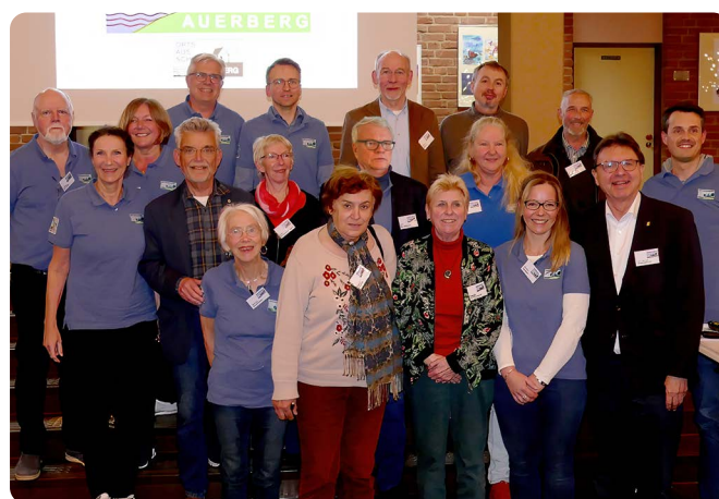
v. oben nach unten, v. li. n. re.

Das Wahlverfahren nach der Satzung und der Geschäftsordnung soll aufgrund nachvollziehbarer Einwände im Laufe der kommenden zwei Jahre im Hinblick auf Transparenz überarbeitet werden.