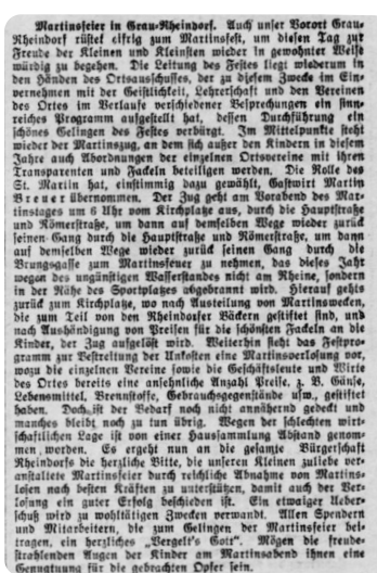
Zeitungsausschnitt vom 06.11.1926 zur Martinsfeier in Grau-Rheindorf Deutsche Reichszeitung

Die rheinische Martinstradition ist seit 2018 als immaterielles Kulturerbe NRW anerkannt. Früher endete das bäuerliche Wirtschaftsjahr am 11.11. zum Sankt-Martins-Tag samt vieler damit verbundener Feiern, Festmähler vor dem Winter und Feuerhaufen gegen die Dunkelheit. Im 19. Jahrhundert versuchten Behörden und Kirche die teils wilden Auswüchse zu lenken mit Besinnung auf Nächstenliebe, Teilen und Lichtbringern samt Vermittlung der Geschichten zum Heiligen Martin.