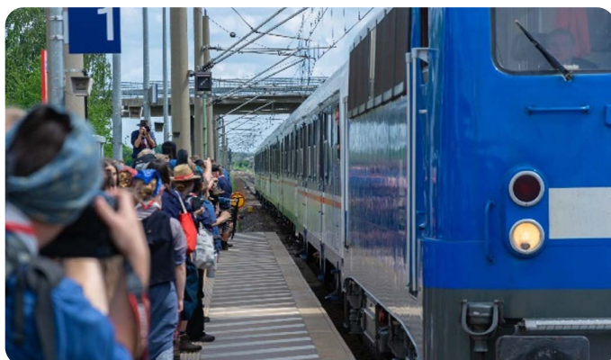
Der kleine Bahnsteig in Niedergörsdorf ist dem Andrang kaum gewachsen!

Die Mitarbeiter des Bahnunternehmens staunten nicht schlecht, als neben den Pfadfindern mit ihren zahlreichen Gitarren auch noch Geige, Kontrabass und Klavier im Zug Platz nahmen. Ein Fahrradabteil diente als Musikzimmer und als der Zug in Herford einen halbstündigen Zwischenhalt einlegte, war auch